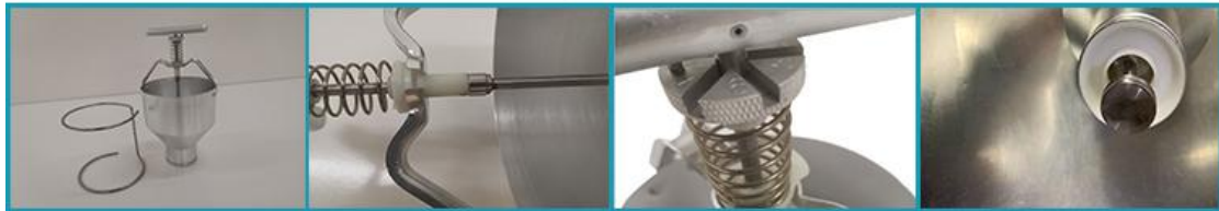
T-3甜甜圈薄饼成型器